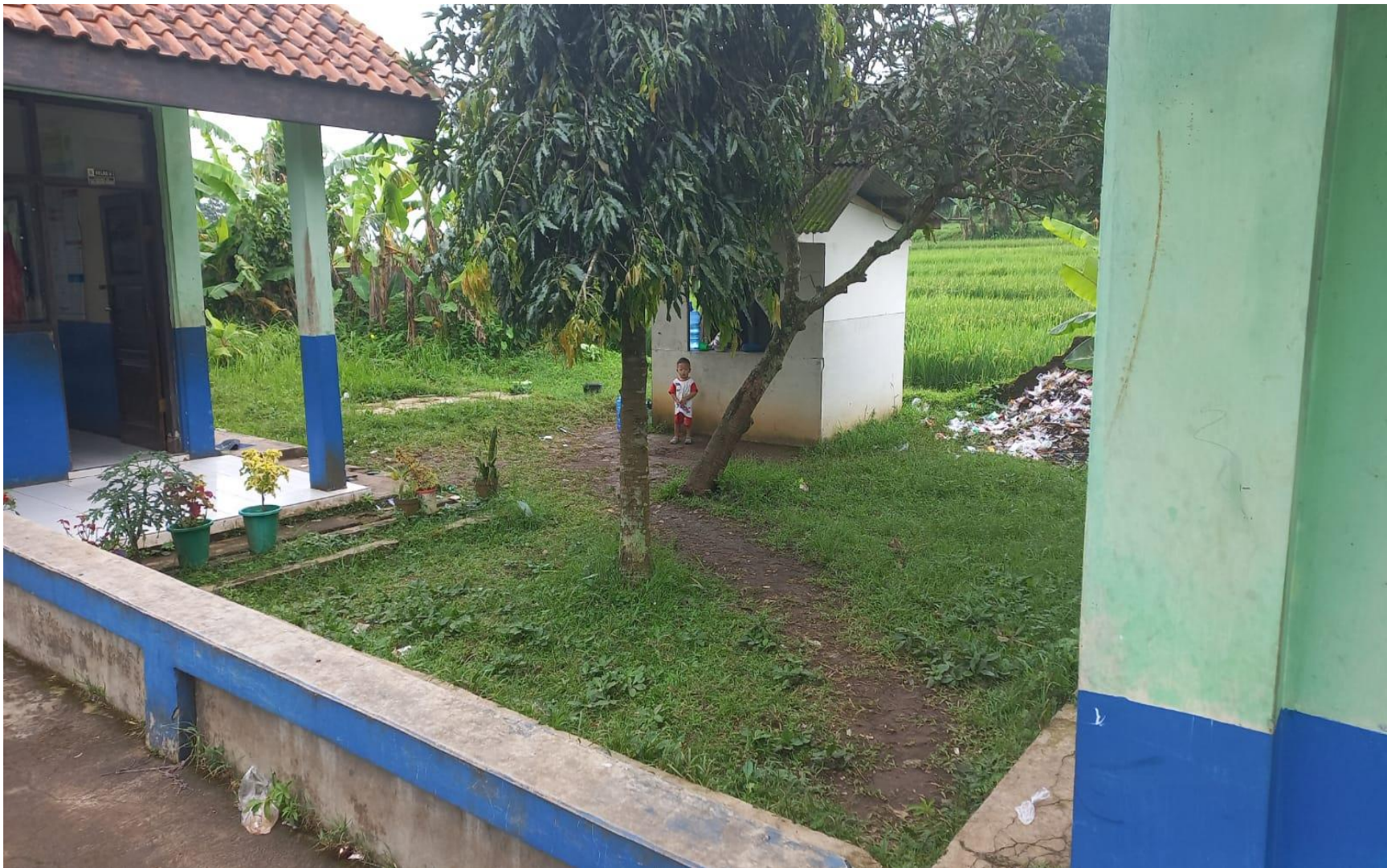
FOTO RENCANA PEMBANGUNAN RUANGAN UKS